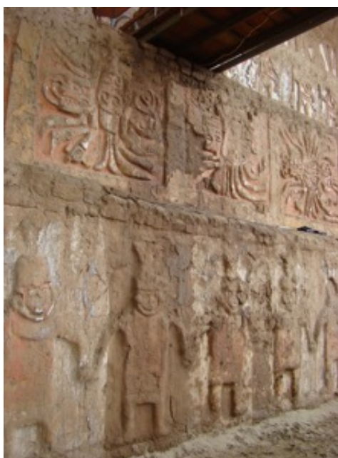
Figura 05: Relieves consolidados (Silicato de Etilo 40) humectados por lluvias y en proceso de secado, sin alteración .

d. Evaluar las técnicas y comportamiento de los materiales de consolidación aplicados en los últimos 40 años de intervenciones en huaca de la Luna y otros sitios arqueológicos de tierra. El silicato de etilo 40 y alcohol etílico es la solución que ha logrado óptimos resultados, ante el impacto hídrico y eólico directos. La primera aplicación la hice en febrero de 1980 y a la fecha no hay alteración (Fig. 05)