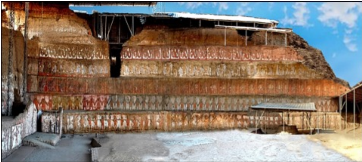
Figura 03: Huaca de la Luna, fachada principal del templo Moche.

broqueles de pelo de camélido. Actualmente se expone a la visita, 1947 m 2 relieves policromados, 437 m 2 pinturas murales y 1173 m 2 enlucidos monocromos, todos consolidados y protegidos bajo cubiertas. (Fig. 03).