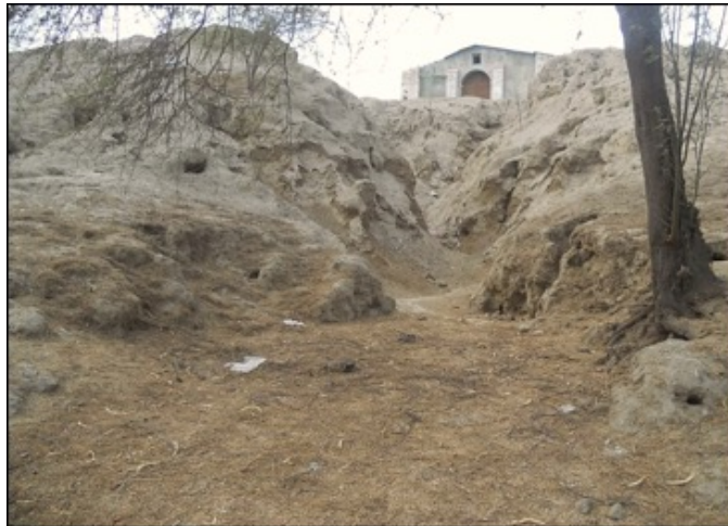
Figura 08: Narihulá, v. Piura. Cárcavas causadas por lluvias intensas que afectan estructuras de tierra.

k. Monitoreo sistemático durante y post impacto de todos los monumentos intervenidos, por ser el eje de la política de investigación para la conservación que se desarrollará y para evaluar el intenso proceso de evapotranspiración y eflorescencia salina post ENSO.