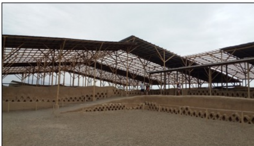
Figura 10: Tschudi, Chan Chan. Construcción de 4,000 m 2 de cubiertas en sector Audiencias.