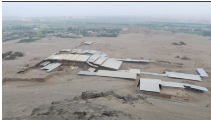
Figura 06: Huaca de la Luna, v. Moche. Cubiertas y drenes, protección de espacios y murales.

g. Construcción de cubiertas, drenes y cortavientos. En este proceso preventivo se han instalado 55,873.58 m 2 de cubiertas o techos provisionales; 4,244.18 m 3 de encausamiento o manejo de cárcavas; recubrimiento de horadaciones y pozos de huaqueo; 2,528 m 3 de reforzamiento estructural; 6,036 ml de canaletas o drenajes suspendidos de la cubierta; 2,745 ml de drenes subterráneos con tubos de PVC y 720 m 2 de cortavientos. (Figs. 06).