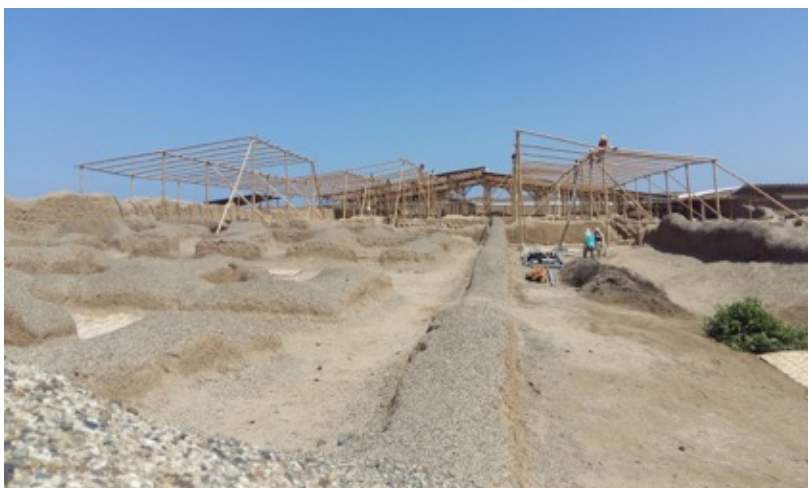
Figura 04: Narihualá, v. Piura. Protección ambiental con cubiertas y drenes

c. Elaborar un protocolo de registro, documentación, monitoreo y mantenimiento inmediato del contexto y de las cubiertas, drenes y cortavientos. Incluye la capacitación del personal técnico y auxiliar.