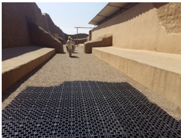
Figura 09: Tschudi, Chan Chan, v. Moche. Protección de pisos en área de visita, con pavimento drenante (geoblocks) y gravilla.

l. Instalar y evaluar una innovadora protección con cubiertas y pisos arqueológicos en sectores de uso turístico. Tschudi, en Chan Chan, experimenta una propuesta piloto: levantamiento topográfico para definir las pendientes de las superficies; colocación de material de sacrificio (tierra estabilizada a la cal), con pendientes de 1% del muro al centro del corredor y planos inclinados a lo largo de éste, de un extremo alto a las cajas de sedimentación o percoladores; instalación del sistema de pavimento drenante: geotextil, geomembrana y celdas drenantes, mallas plásticas de polipropileno reciclado, 5 cm de alto, las celdas se rellenan con gravilla para generar un tránsito turístico confortable y el acarreo de materiales, mientras el agua pluvial escurre entre la geomembrana y la malla, evitándose charcos, lodazales, pérdida de material y mejorando la presentación del monumento (Figs. 09 y 10).