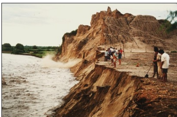
Figura 01: Destrucción de huaca Taco por río Reque, v. Reque. ENSO 1997-1998